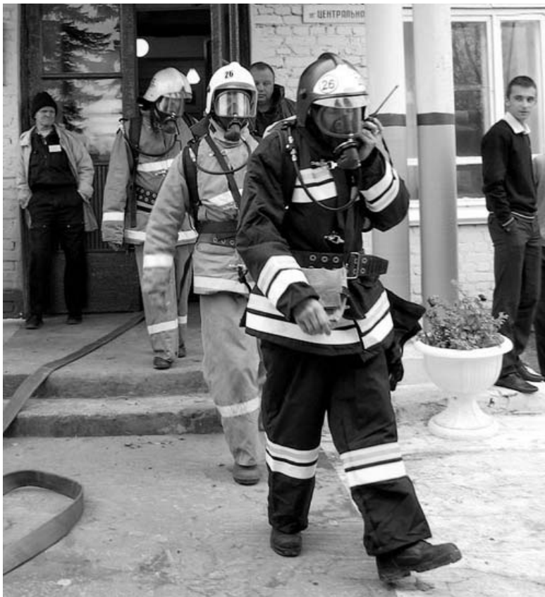
Работа по эвакуации людей и тушению пожара завершена.