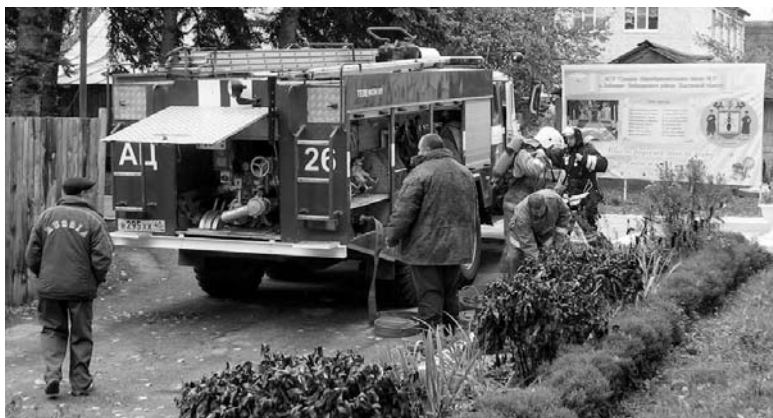
Быстро и слаженно.