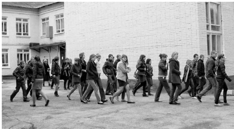
Эвакуация из здания.

Насколько каждый из нас готов к различного рода неожиданностям, например, пожару? Что и в каком порядке мы будем делать? Что возьмем, выбегая из квартиры, в первую очередь, и хорошо ли помним, где искать это «самое нужное»?